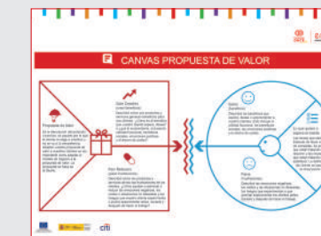
CANVAS PROPUESTA DE VALOR