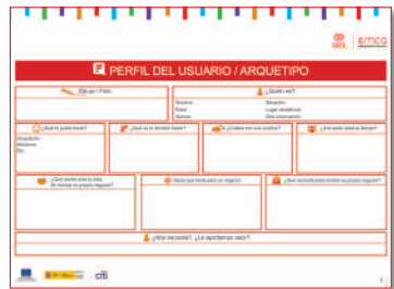
PERFIL DEL USUARIO/ARQUETIPO